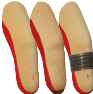
Cool Liner VSC